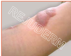
اسکار برجسته روی بازو