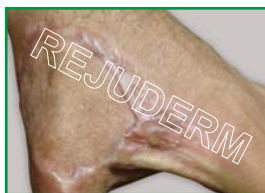
اسکار برجسته بعد از پیوند پوست (روی دست)