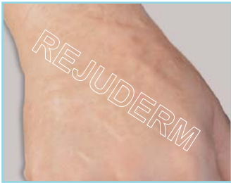
بعد از ۹ ماه استفاده از رژودرم روشن شدن، نرم شدن و کاهش ضخامت اسکار