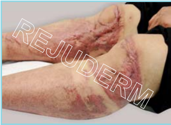
اسکار بالغ شده