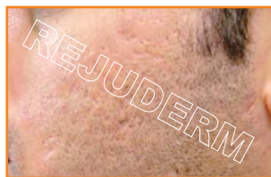
اسکار ناشی از جوش (روی گونه)