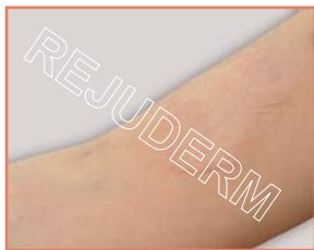
تاثیر رژودرم در مدت ۱۸ ماه

تذکر: در صورت قطع زودهنگام رژودرم، روند تحلیل رفتن اسکار متوقف می‌شود ولی اسکار دوباره رشد نخواهد کرد. با استفاده‌ی مجدد، روند فوق دوباره آغاز می‌گردد.