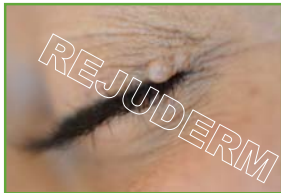
زائده‌ی گوشتی (روی پلک)