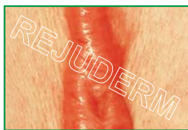
نمایش از نزدیک به تفاوت بین بافت اسکار با پوست دقت کنید.