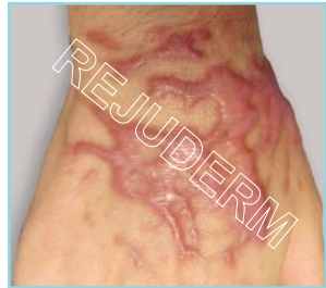
اسکار بالغ نشده (روی دست)