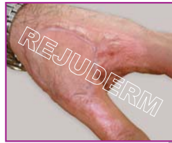
اسکار یا گوشت اضافه در اطراف پوست پیوند شده در حال رشد است.