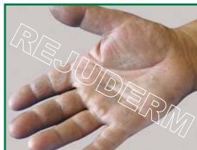
زبری و ضخامت پوست