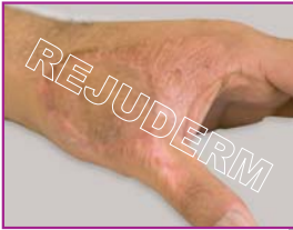
۹ ماه بعد از استفاده از رژودرم