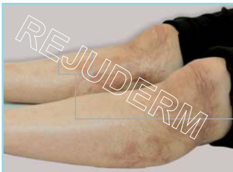
بعد از دو سال استفاده از رژودرم

عکس پایین با استفاده از لنز ماکرو گرفته شده است که بخش مشخص شده را از نزدیک نمایش می‌دهد.