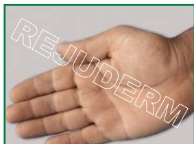
دو هفته بعد از استفاده از رژودرم

پیش از استفاده‌ی مجدد باید موضع را با آب گرم بشویید.