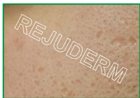
اسکار فرورفته ناشی از جوش (روی صورت)