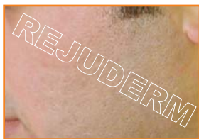
۸ ماه پس از استفاده از رژودرم

در صورتی که پوست شما به مواد چرب حساس نیست دو ساعت بعد از استفاده از رژودرم، مقدار بسیار کمی پماد آلفا را روی موضع قرار داده و به آرامی و بدون فشار ماساژ دهید. مقدار پماد باید در حدی باشد که فقط یک لایه‌ی روغنی زیر انگشتان احساس کنید. ۱۵ دقیقه پس از استفاده از پماد آلفا موضع را با آب ولرم و صابون بشویید. در پوست‌های چرب و مستعد به آکنه، استفاده از رژودرم به تنهایی کافی است.