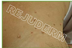
زائده‌ی گوشتی (پشت گردن)